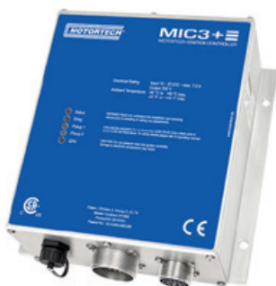
MIC3+ MOTORTECH IGNITION CONTROLLER

Die benannten Zündsteuergeräte erfüllen mit Einführung der neuen Dichtungen dann die Schutzart IP69.