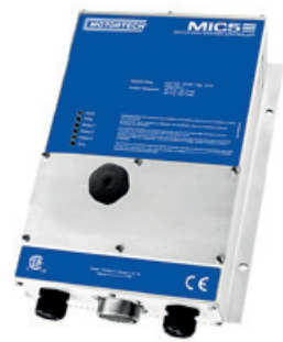
MIC5 MOTORTECH IGNITION CONTROLLER

MOTORTECH GmbH Hogrevestr. 21-23 29223 Celle, Germany Telefon: +49 5141 - 93 99 0 Fax: +49 5141 - 93 99 99 www.motortech.de motortech@motortech.de