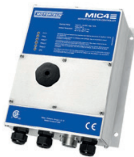
MIC4 MOTORTECH IGNITION CONTROLLER